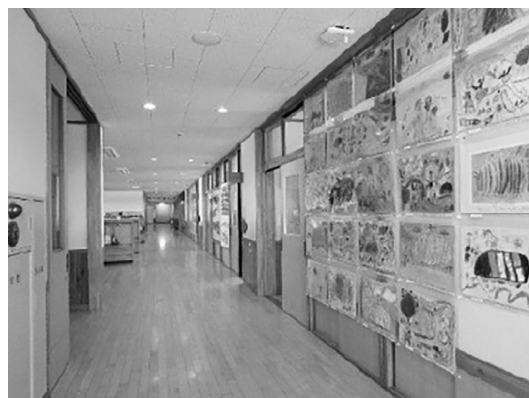
下諏訪南小学校廊下

す。以前は年度の最初と最後は教育委員4名全員で小中4校に伺っていましたが、それも叶わず、コロナの影響で中止になることも多くなりました。参観日だけでなく、運動会や音楽会、入学式や卒業式など、子ども達の晴れ舞台には本来、多くの地域の皆さんが来賓として参加されていました。卒業式や入学式に参列されていた方からは、「いや、見たかった。本当に残念」とのお声をいただいています。放課後子ども教室や祖父母参観など、地域の方が先生になって手品を披露したり、得意な分野で子ども達に勉強や遊びを教えてくれたり。コミュニケーションの活動で支えてくださる方もいらっしゃいます。そんな地域と学校、家庭が互いに連携して、子ども達の学びや育つ