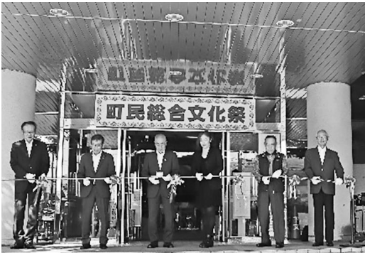
9月30日(金) 町民文化祭オープンセレモニー