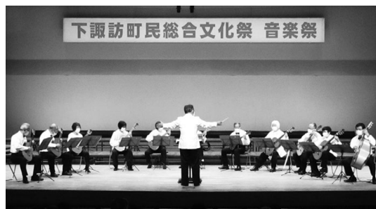
下諏訪町民総合文化祭 音楽祭

結びに、これからも「みんなで作る音楽祭」として小中学生諸君や多くの団体に参加していただき、さらに進化し実行できることを心から願っています。