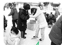
下駄スケート体験

メール配信システムはこのQRコードを読み取ったリンク先の案内に従い登録してください。