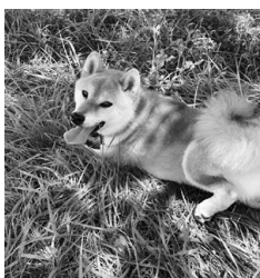
我が家の愛犬 征十郎

私は今のところ、大学卒業後すぐに長野県に戻ることにするのかまだ分かりません。しかしいつかは長野県に帰ってきたいと思っています。それまでにたくさんさんの知識や能力を培い、私を育ててくれた長野県、そして下諏訪町に何らかの形で還元できるように大人になりたいです。そのためにも、まずは、これからたくさんさんのことを経験したいと思っています。